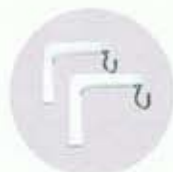
ขาแขวนจอ