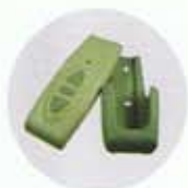
Wireless Remote Control ชุดรีโมทคอนโทรล