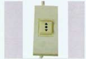
สวิทช์ควบคุมจอ