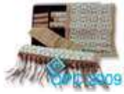
ผ้าคาดโต๊ะ ผ้าคาดโต๊ะ