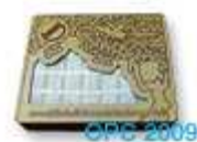
ผ้าปูโต๊ะ ผ้าปูโต๊ะ