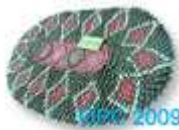
พรมเช็ดเท้า พรมเช็ดเท้า