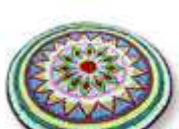
พรมปูพื้นผ้าจิบ พรมปูพื้นผ้าจิบ