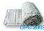
พรมปูพื้น พรมปูพื้น